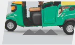
উচ্চ গ্ৰাউণ্ড ক্ৰিয়াৰেঞ্চ