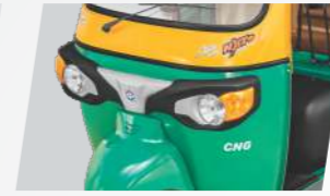
ষ্টাইলিছ ফ্ৰন্ট ফেচকিয়া