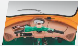
বহু তথ্যমূলক প্ৰদৰ্শন