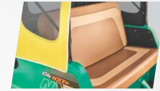
ডুৱেল টোন আসন