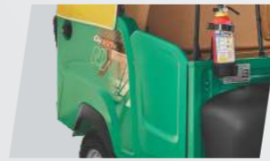
যাত্ৰী সুৰক্ষা দুৱাৰ