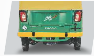
ষ্টাইলিছ ৰিয়েৰ বাম্পাৰ