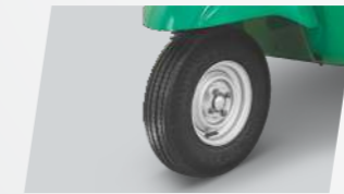
3 হইলাৰ চেগমেণ্টত টিউবলেছ টায়াৰ প্ৰথম