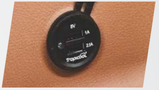
ডুৱেল পোর্ট ইউএচবি দ্রুতগামী চার্জাৰ